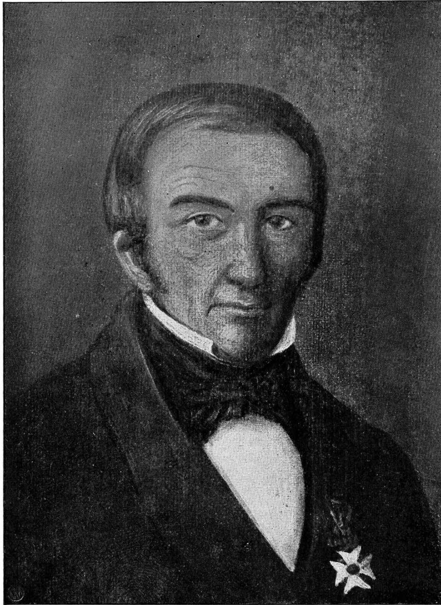
STIFTAMTMAND CARL VALENTIN FALSEN